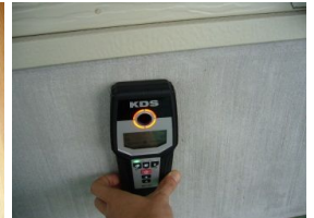
金属探知機による基礎の調査