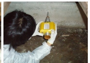
コンクリート強度の調査