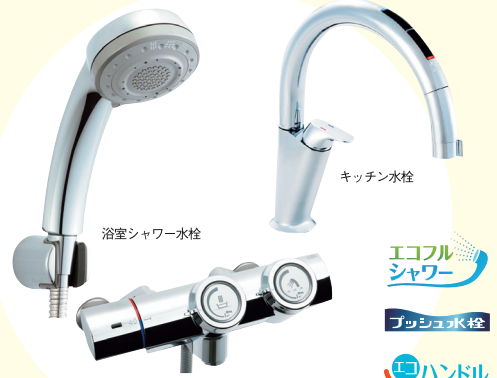
浴室シャワー水栓