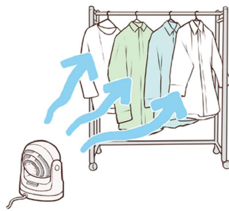
部屋干し時、扇風機やサーキュレーターも、下から上へ風を送るようにすると良いですよ。

湿気で困るのが、玄関。おうちの顔なので、清々しい雰囲気になりたいですね。靴箱を開放して湿気を追い出したり、まめに掃除するのももちろん、靴の湿気を追い出すことも大切です。同じ靴は連続で履かず1日休ませることで、乾燥させることができます。雨で濡れたときは、新聞紙を丸め