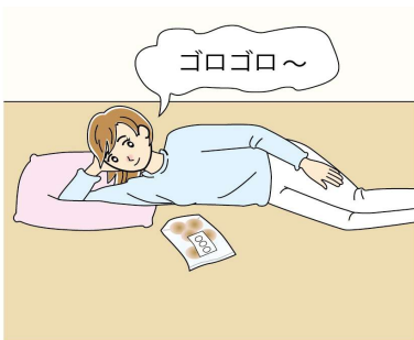
体がバテてしまう要因として、湯船に浸からず、疲れが取れづらくなることや、運動不足もあります。

また、暑いと冷たい飲み物をたくさん飲んでしまいがちですが、冷たすぎる飲み物は胃腸の働きを鈍くさせ、