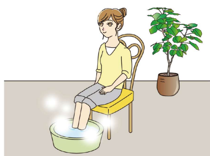
ちょっと疲れたな、というとき、手湯や足湯でゆつたりリラックスしてみるのも良いですね。

朝、起きたての1杯の水や白湯の代わりにホット炭酸水を飲むと炭酸の作用によって血行も促進されるのか。コップ1杯なら、電子レンジ600Wで30秒程度が目安。40℃前後に温めるのがおすすめです。 ・ホット炭酸水は手湯や足湯にもおすすめ…炭酸ガスが皮膚から浸透し、血管が開きやすくなり、血行が促進されるそうです。冷え性対策にも良いですね。1回、だいたい15分程度が