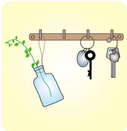
鍵は、玄関の壁にフックを設置して引っかけるのも良いですね。